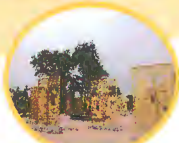
大明宫国家遗址公园