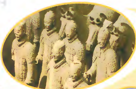
秦始皇兵马俑博物馆